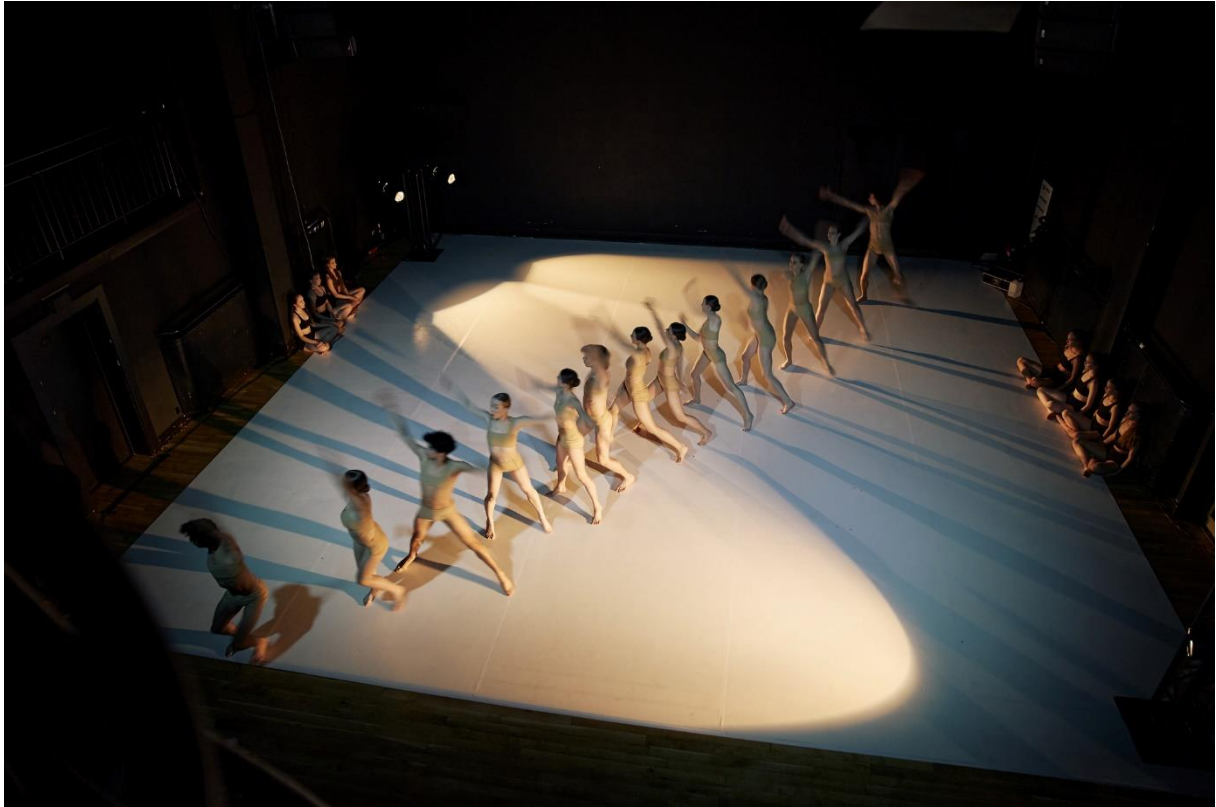
SALA TEATRALNO-KONCERTOWA (SALA SUWNICOWA)