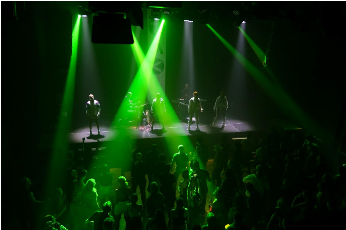
SALA TEATRALNO-KONCERTOWA (SALA SUWNICOWA)