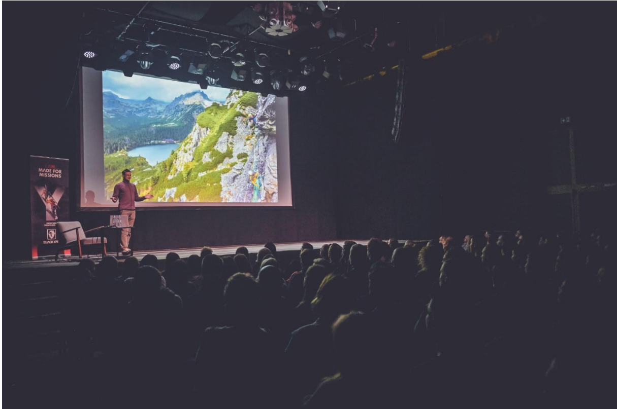
SALA TEATRALNO-KONCERTOWA (SALA SUWNICOWA)