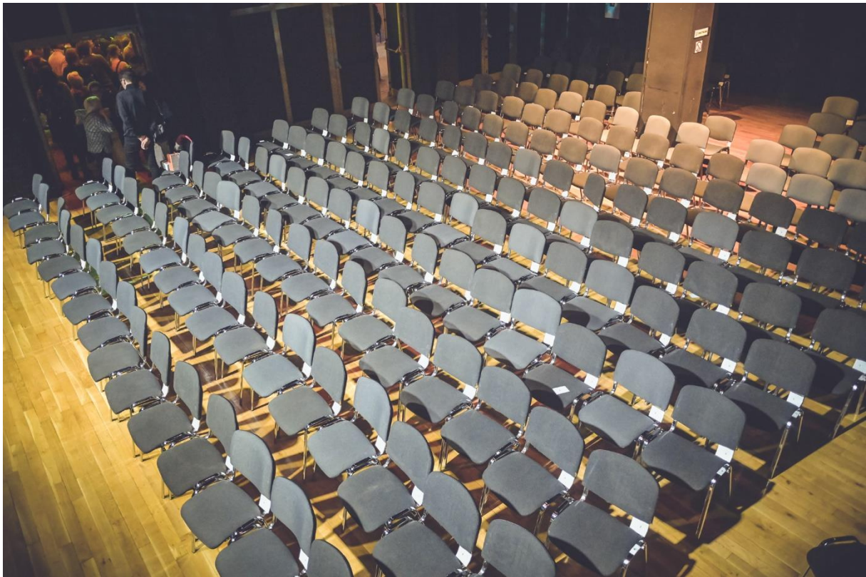
SALA TEATRALNO-KONCERTOWA (SALA SUWNICOWA)